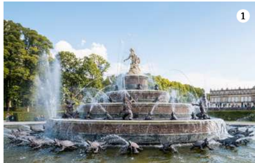
1+2 Nieuw paleis Herrenchiemsee Dit kasteel is een UNESCO Werelderfgoed- locatie sinds 12 juli 2025

Als u door Beieren reist van de Chiemsee en kasteel Neuschwanstein in het zuiden naar Regensburg aan de Donau, komt u door een gebied dat is doordrenkt van koninklijk erfgoed en adembenemende landschappen – met sprookjes, een hall of fame en de oudste kloosterbrouwerij ter wereld.